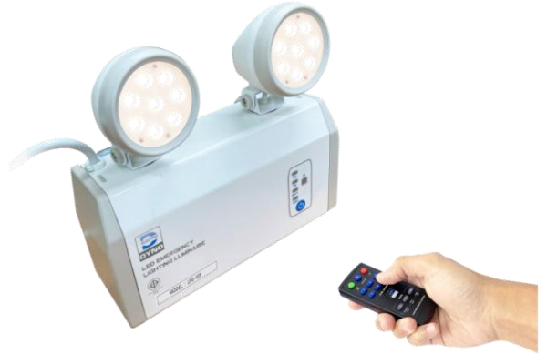
รีโมทเป็นอุปกรณ์เสริมซึ่งจำหน่ายแยก